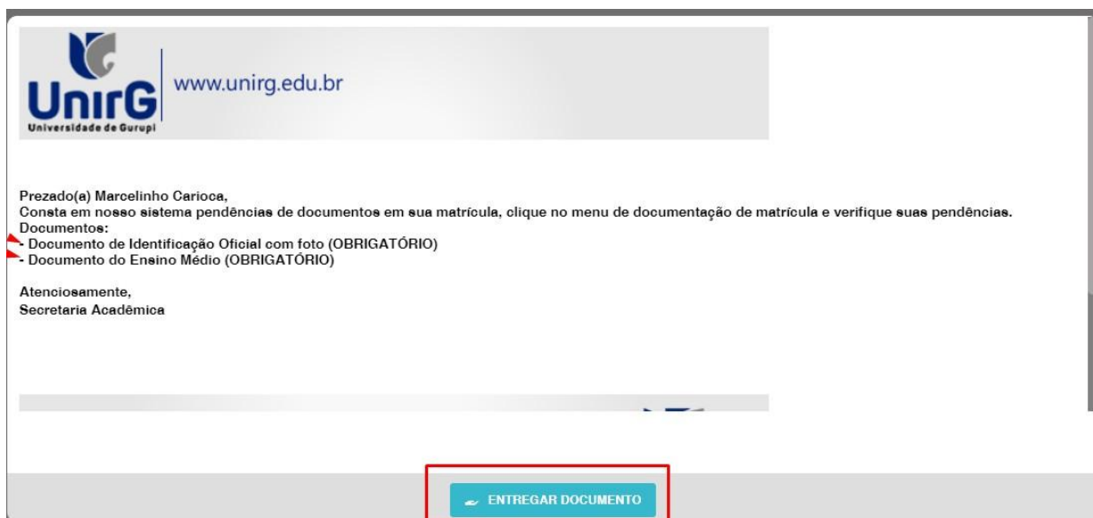
IMAGEM 02: Tela que apresenta os documento obrigatórios para realização da matrícula.

VI. O sistema te redirecionará para tela DOCUMENTOS ENTREGUES onde deverá realizar-se o upload /anexar individualmente os documento solicitados. Lembrado que os documentos que possuem frente e verso, devem ser digitalizados no mesmo arquivo. Ao realizar o upload de todos os documentos, deve-se clicar no ícone GRAVAR .