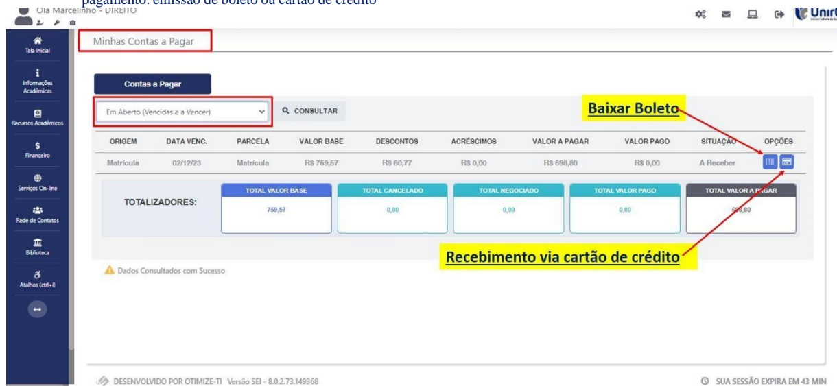
IMAGEM 06: Tela para retirada do boleto de pagamento ou efetivação de pagamento via cartão de crédito.

Após a Compensação do valor monetário referente, a matrícula estará EFETIVADA .