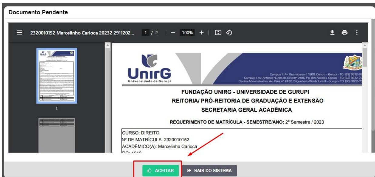
IMAGEM 01: Tela que apresenta o Requerimento de matrícula e Termo de adesão contratual para ser assinado.

IV. Ao realizar o Login, a primeira tela apresenta o REQUERIMENTO DE MATRÍCULA . Faça uma leitura, e em seguida clique em ACEITAR **.