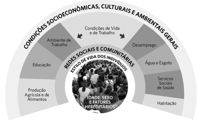
Modelo dos Determinantes Sociais da Saúde (DSS) proposto por Dahlgren e Whitehead (1991) e adotado pela OMS

Para que se possa compreender o processo saúde-doença na sua perspectiva mais ampla, é fundamental considerar a influência que os DSS (fatores sociais, econômicos, exercem na vida das pessoas.