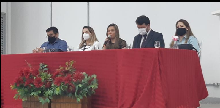
Certificação dos pesquisadores Projeto EPICOID

➤ Capacitação “Revisão Sistemática de Literatura- RSL”