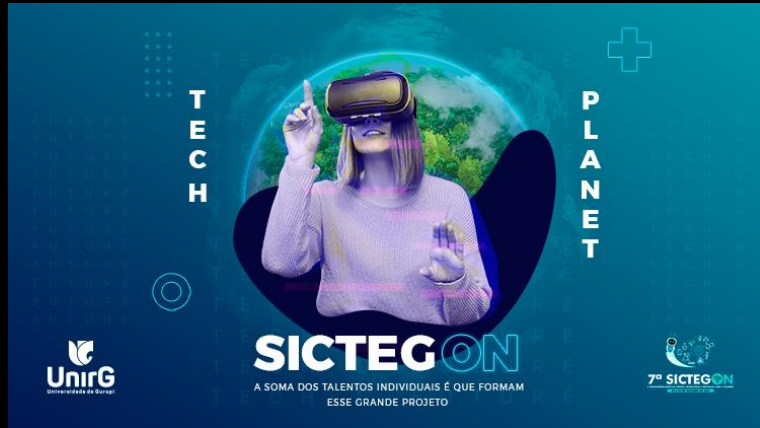
7ª SICTEG ON - Semana Integrada de Ciência e Tecnologia de Gurupi