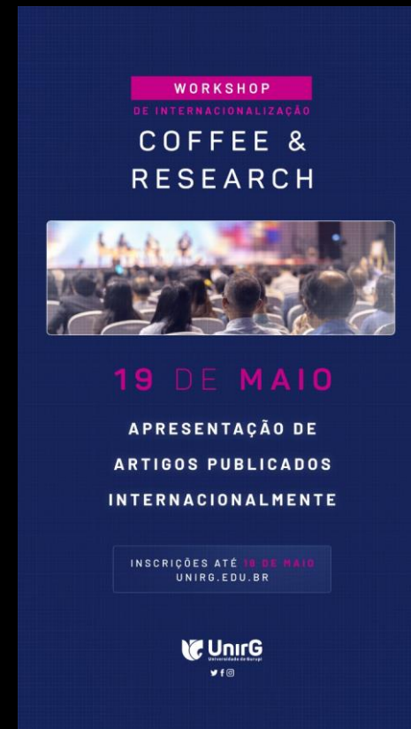
I Coffee & Research