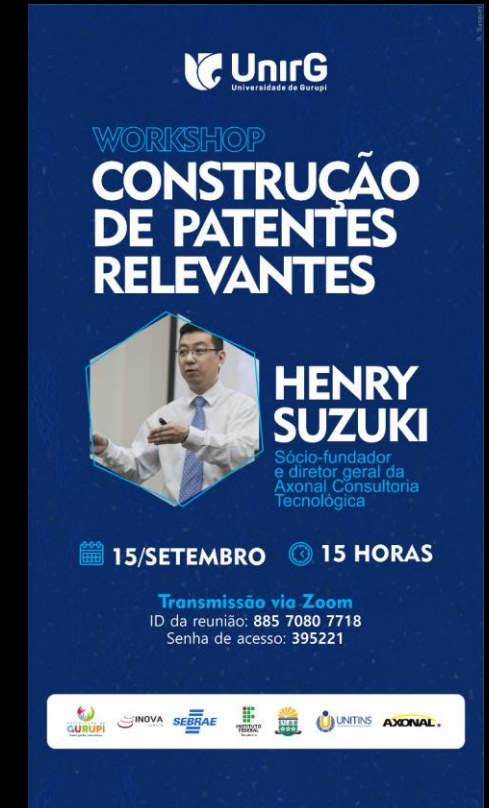
Workshop Construção de Patentes Relevantes