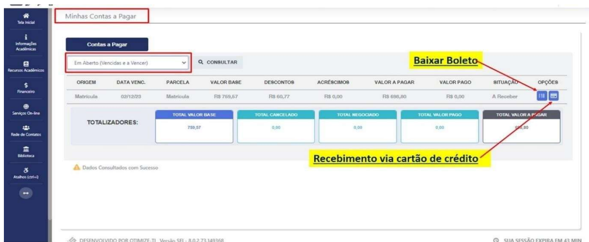
IMAGEM 03: Tela para retirada do boleto de pagamento ou efetivação de pagamento via cartão de crédito.