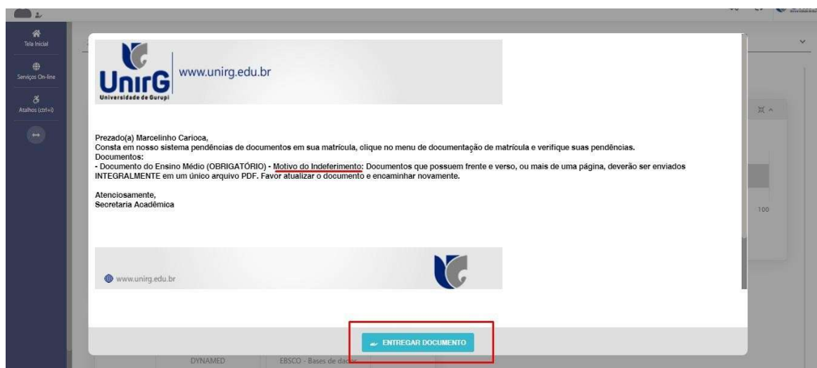
IMAGEM 04: Exemplo de indeferimento de documento e suas motivações.

► Ao acessar o seu usuário na Plataforma SEI-Otimize, o sistema trará a alerta sobre a pendência de documento, informando qual documento e os motivos que fizeram ser rejeitado.