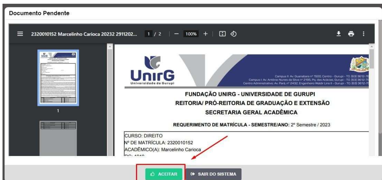
IMAGEM 01: Tela que apresenta o Requerimento de matrícula e Termo de adesão contratual para ser assinado.