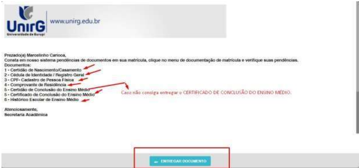
IMAGEM 02: Tela que apresenta os documento obrigatórios para realização da matrícula.