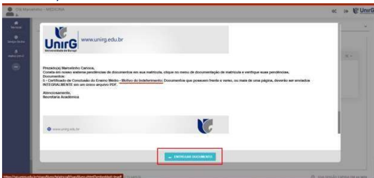
IMAGEM 07: Exemplo de indeferimento de documento e suas motivações.