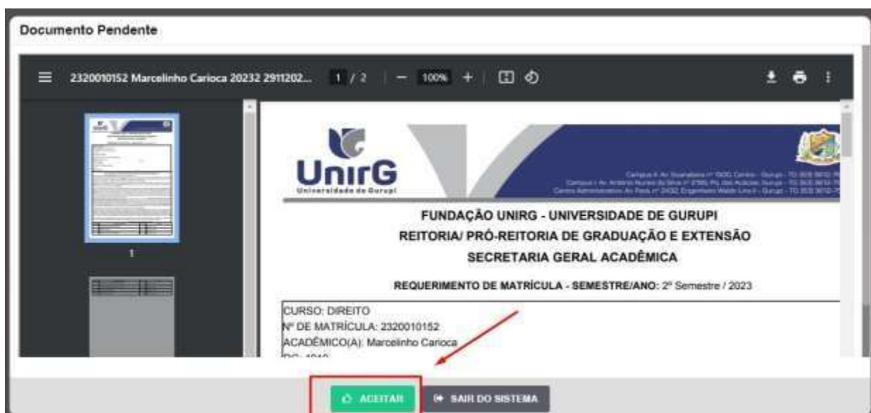
IMAGEM 01: Tela que apresenta o Requerimento de matrícula e Termo de adesão contratual para ser assinado.

III. Ao realizar o Login, a primeira tela apresenta o REQUERIMENTO DE MATRÍCULA . Faça uma leitura, e em seguida clique em ACEITAR **.