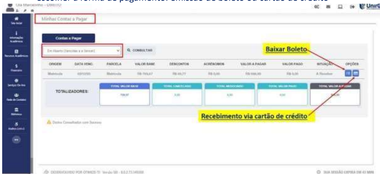
IMAGEM 06: Tela para retirada do boleto de pagamento ou efetivação de pagamento via cartão de crédito.

Após a Compensação do valor monetário referente, a matrícula estará EFETIVADA .