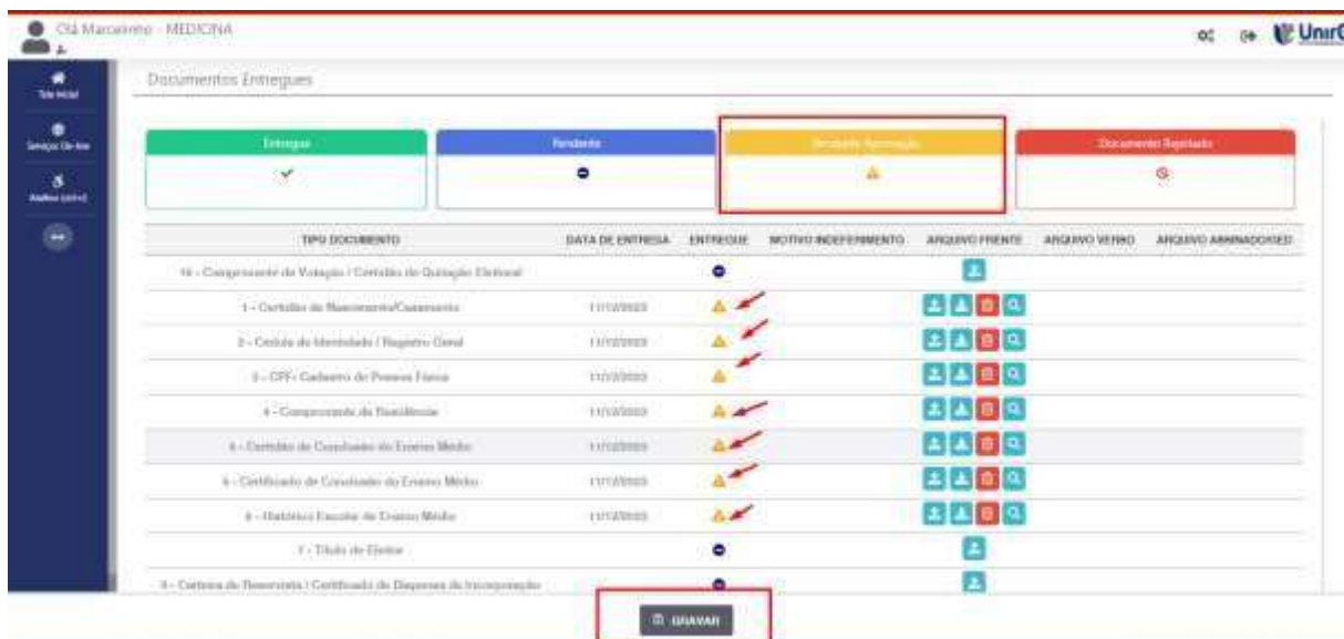
IMAGEM 04: Tela após postar os Documentos.