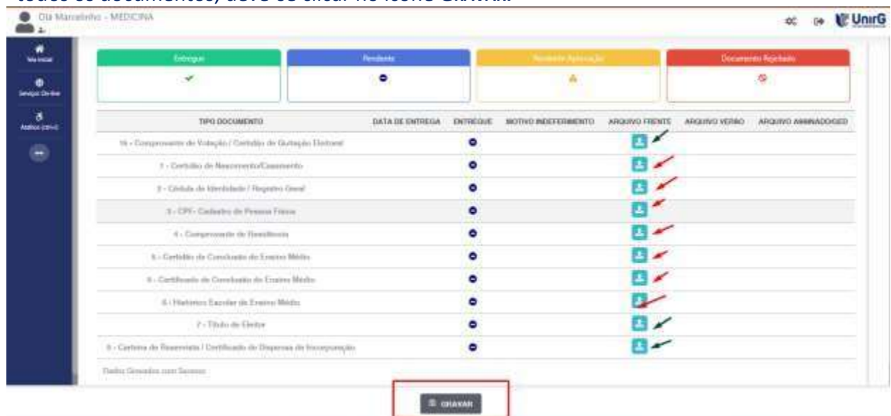
IMAGEM 03: Rol de documentos que compoem o Dossiê Acadêmico do Aluno.