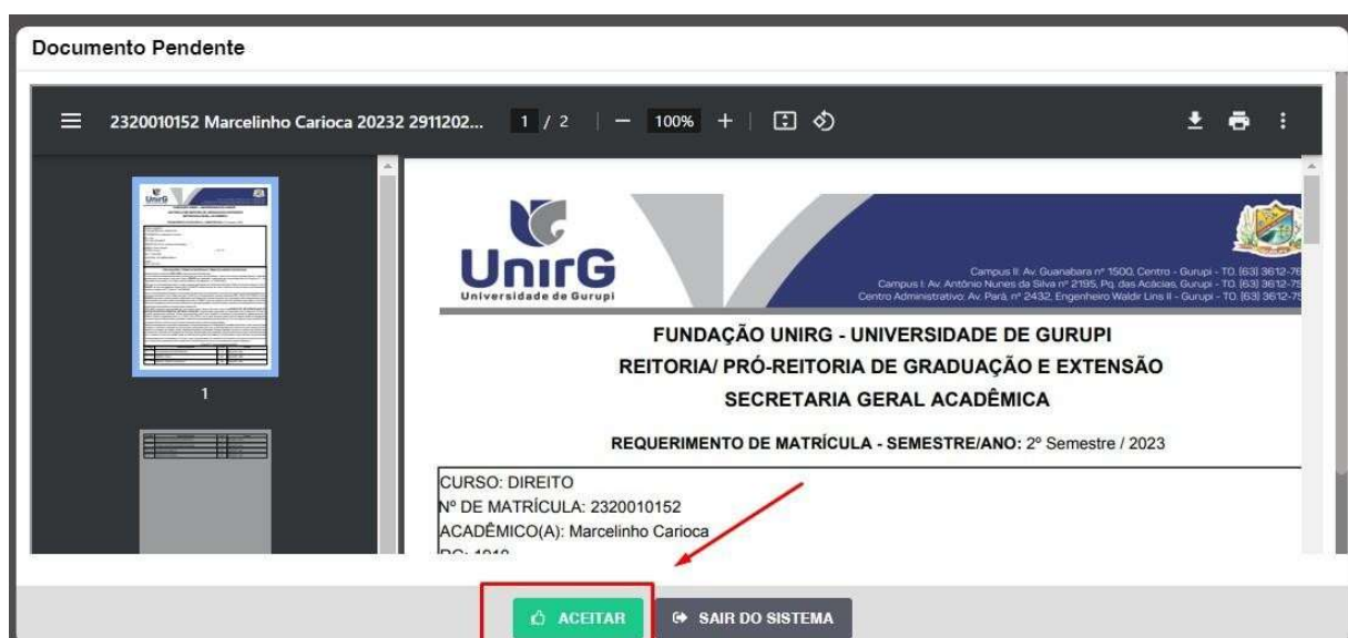
IMAGEM 01: Tela que apresenta o Requerimento de matrícula e Termo de adesão contratual para ser assinado.