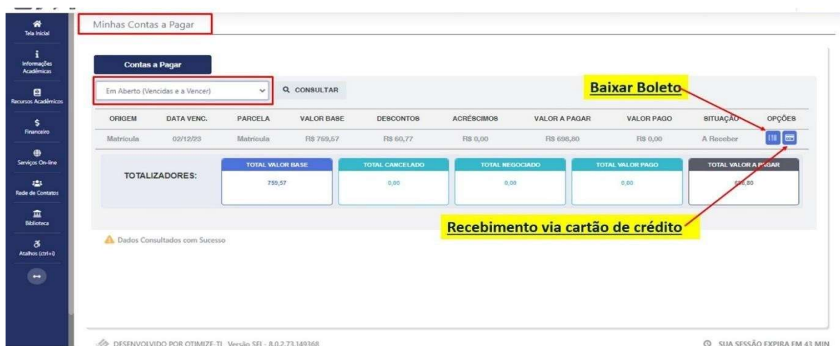
IMAGEM 03: Tela para retirada do boleto de pagamento ou efetivação de pagamento via cartão de crédito.