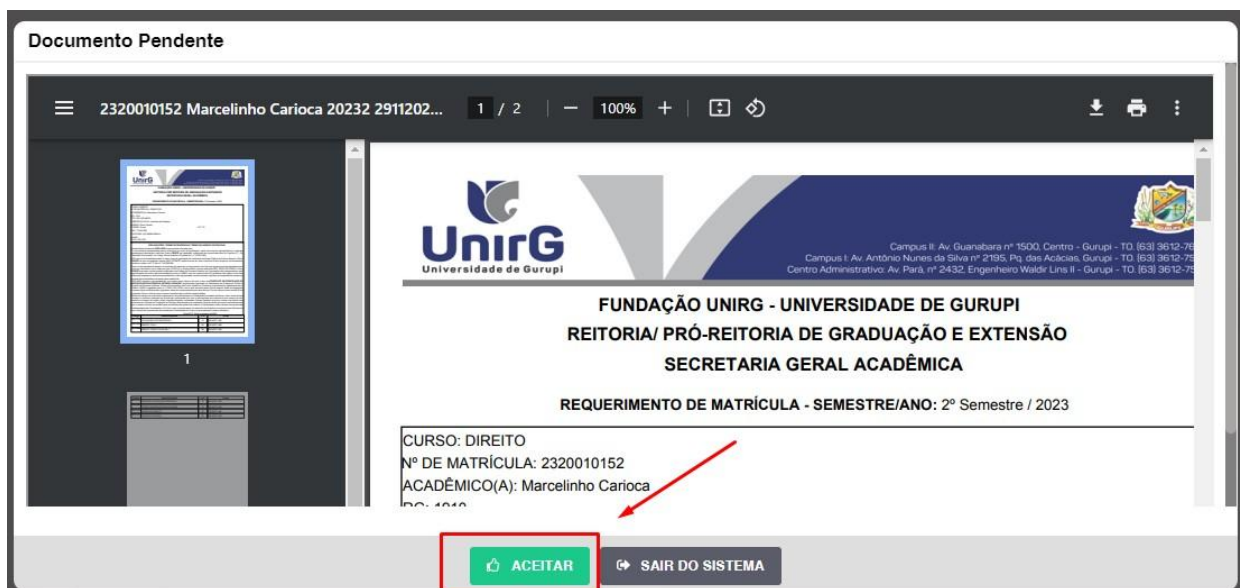
IMAGEM 01: Tela que apresenta o Requerimento de matrícula e Termo de adesão contratual para ser assinado.

IV. Ao realizar o Login, a primeira tela apresenta o REQUERIMENTO DE MATRÍCULA . Faça uma leitura, e em seguida clique em ACEITAR **.