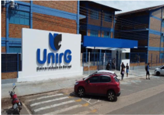
Melhorias nos blocos A e B – Campus II