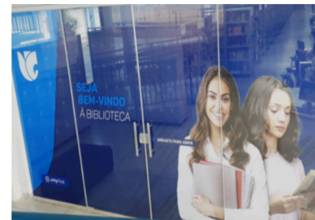
Identidade Visual dos departamentos