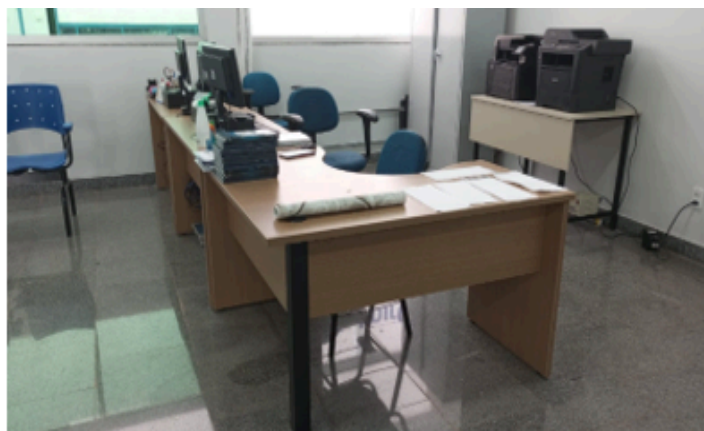
Aquisição de mobiliários - Diversos departamentos