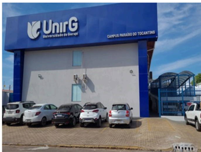
Pintura Unidades I e II – Campus Paraíso do Tocantins