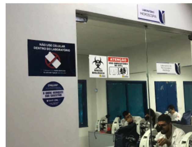
Laboratório de microscópios (Aquisição de microscópios)