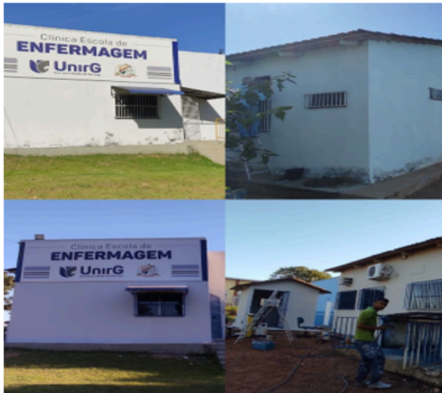
Pintura da Clínica Escola de Enfermagem