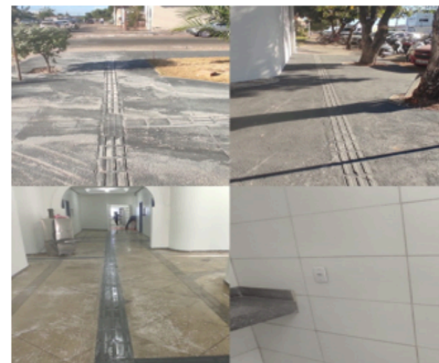
Reforma do Núcleo de Práticas Jurídicas (NPJ)