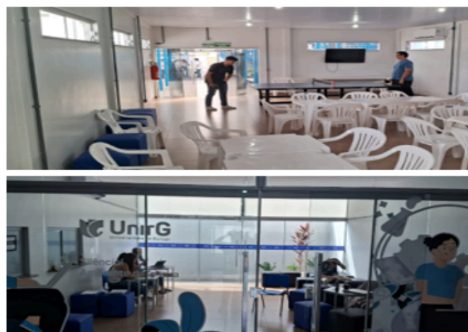
Espaço de convivência da Unidade I Campus Paraíso do Tocantins