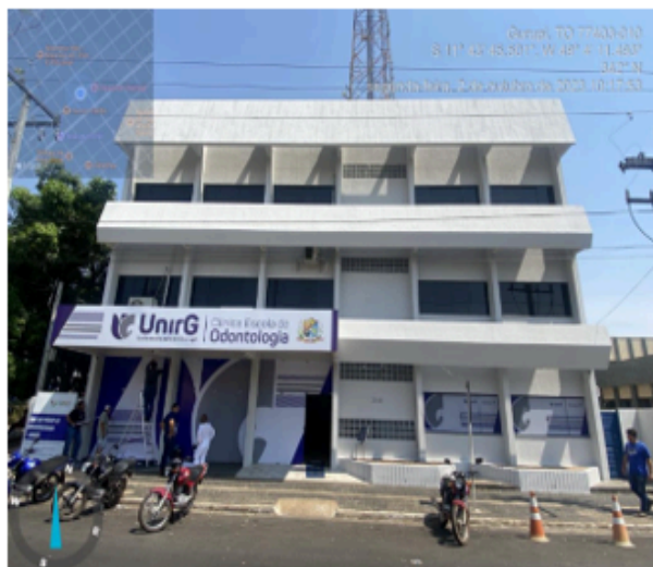
Reforma da Clínica Escola de Odontologia

Sua participação gerou melhorias! Veja algumas delas: