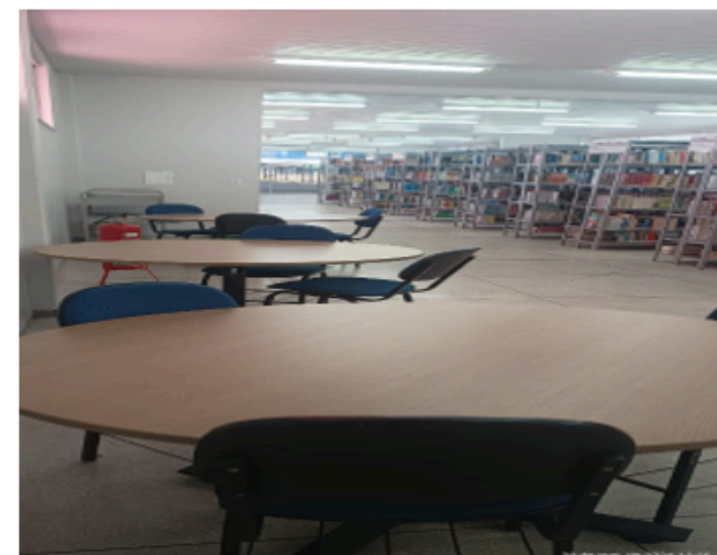
Melhorias no espaço da biblioteca – Campus I e II