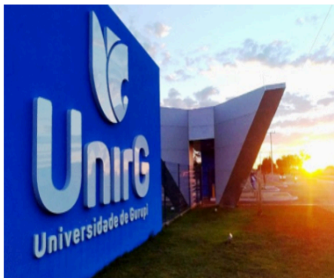
Identidade Visual dos prédios