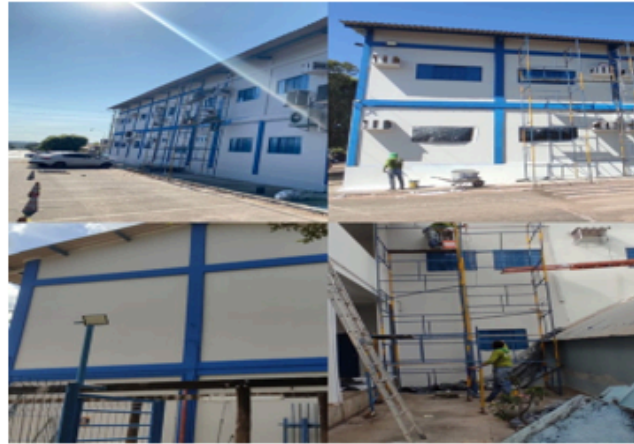
Melhorias no bloco C – Campus II