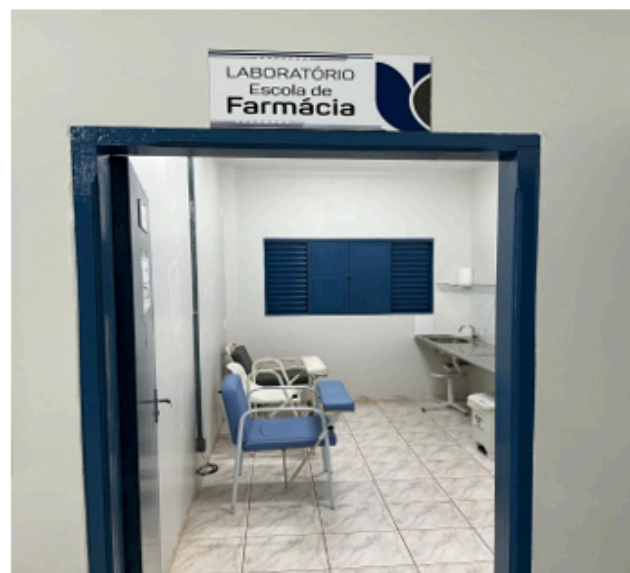
Melhorias no laboratório escola de farmácia