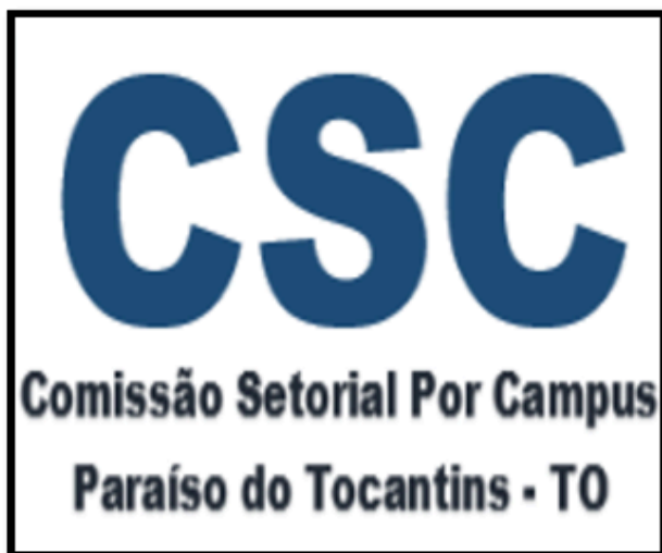
Implantação da CSC – Campus Paraíso do Tocantins