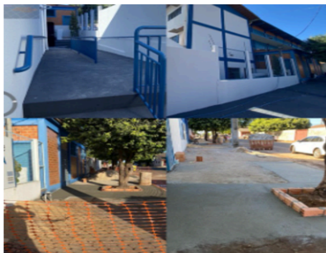
Reforma na Clínica Escola de Fisioterapia