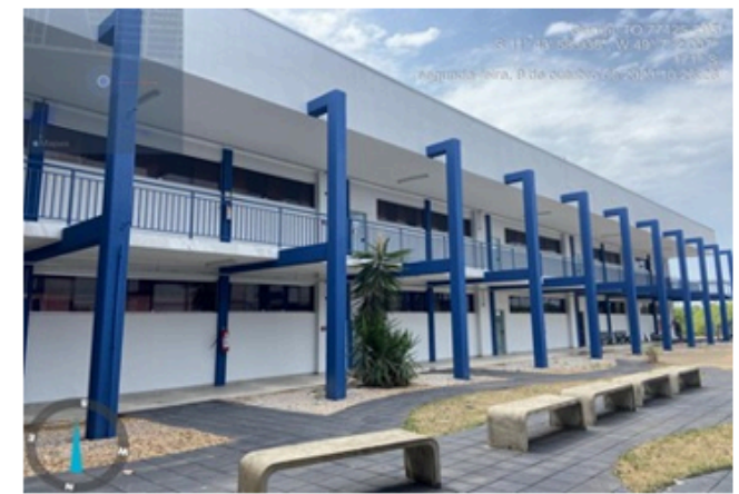
Reformas dos blocos E e F – Campus I