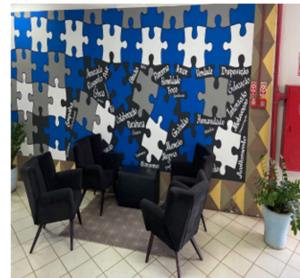
Hall de convivência dos servidores – Centro Administrativo