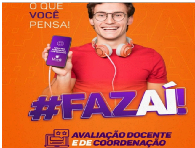
Implantação da Avaliação Docente e de Coordenação