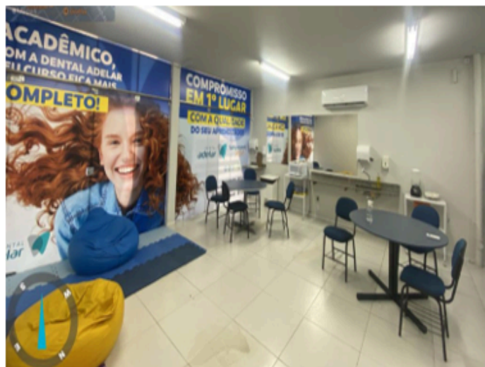
Espaço de convivência - Clínica Escola de Odontologia