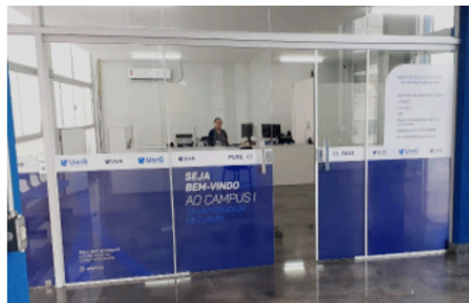
Identidade Visual dos departamentos