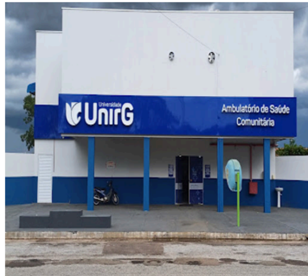
Reforma no Ambulatório da Saúde Comunitária