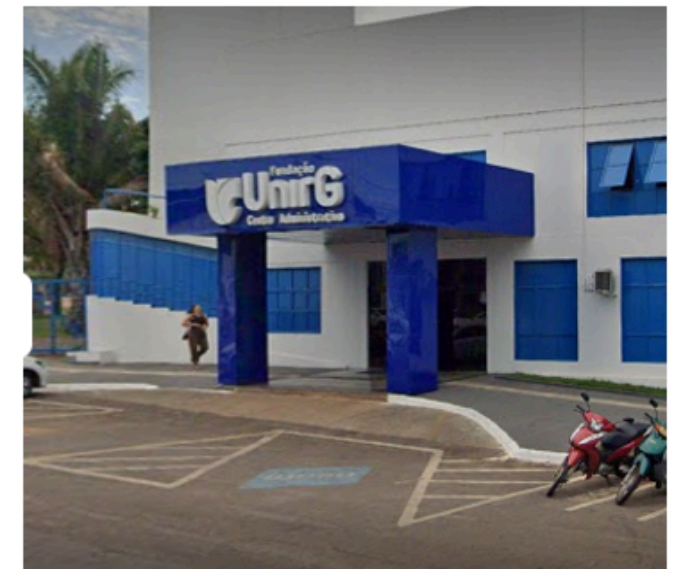
Melhorias no Centro Administrativo – Fundação UnirG