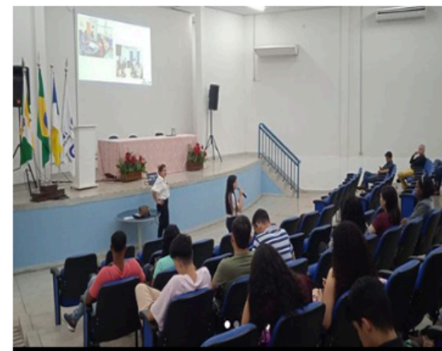
Aproximação da CPA com a Comunidade Acadêmica