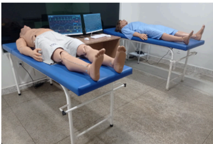
Finalização do centro de Simulação Realística